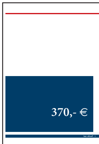
1/2 Seite: 186 x 140 mm

Papierformat 1 Seite: 210 x 297 mm Satzspiegel: 186 x 245 mm Doppelseite: 420 x 297 mm Anschnitt: 3 mm umlaufend