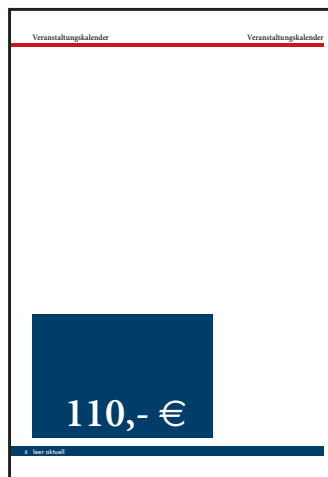
Visitenkarte: 92 x 50 mm