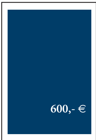
1 Seite: 186 x 280 mm